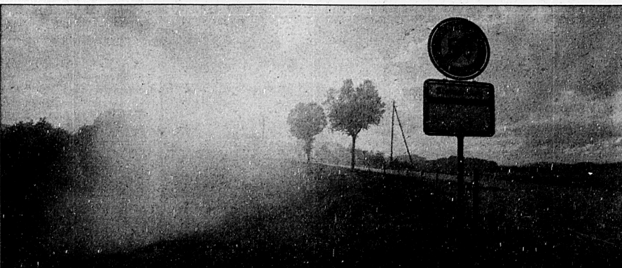
Wenn Nebelschwaden den Sternenberg umwabern, wird aus dem Abendspaziergang eine Seelenwanderung.

offenbaren. Reisst hernach der Himmel auf und leuchten einem später die ersten Sterne, lässt sich nach dem Abstieg ins Tössal sogar der Alltag wieder ertragen.