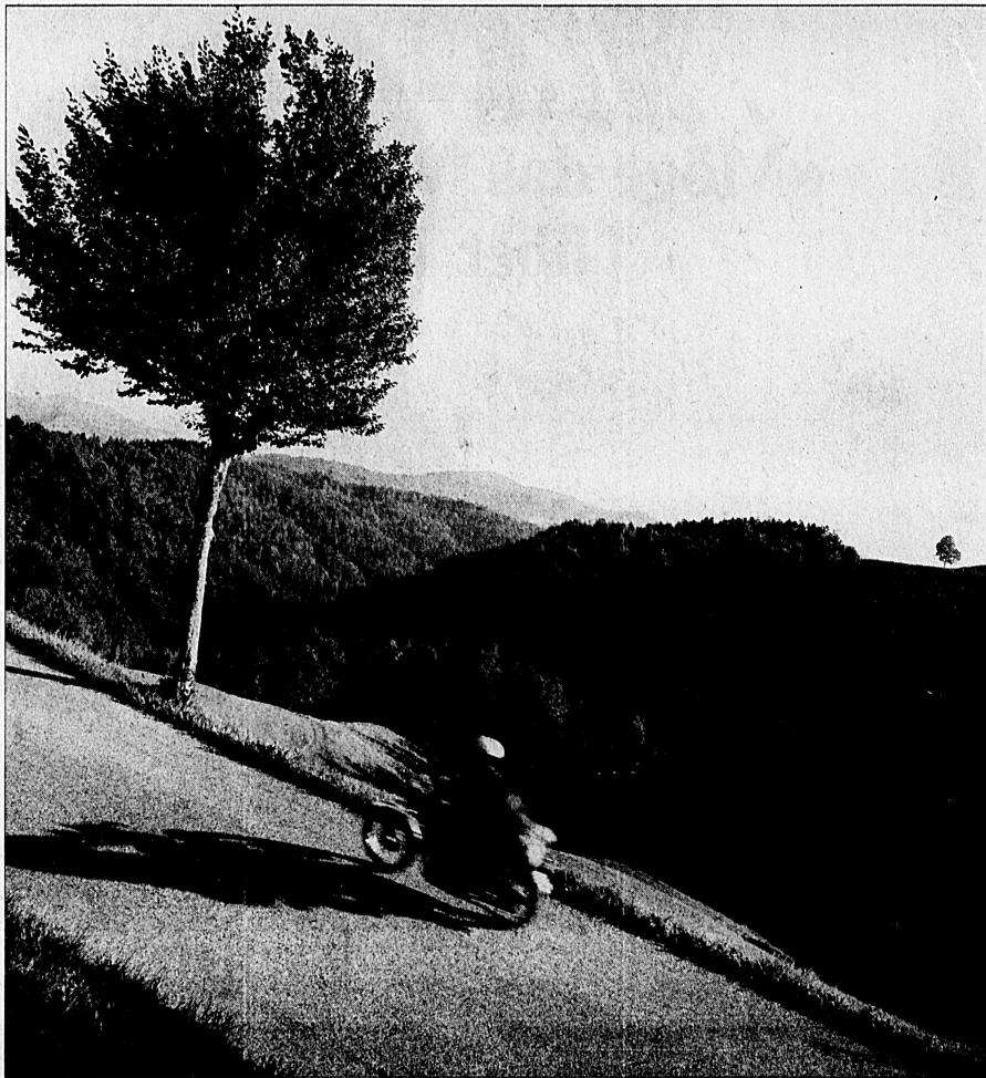
Manche suchen auch die freie Fahrt. An malerischen Hügeln vorbei führt die kurvenreiche Strasse sie zu einem Glas Most.

Weit mehr zu reden gibt im Dorf die Frage, ob es der neuen Wirtin gelingen werde, den im Frühjahr wegen Konkurses geschlossenen und Ende Juli nach langem Warten und Bangen wiedereröffneten «Sternen» am Leben zu erhalten, diesen neben Postbüro und Dorfladen einzigen Treffpunkt, wo schon so mancher wichtige Beschluss bereits vor der Gemeindeversammlung besiegelt wurde. Ohne gemütliche Dorfbeiz, darin sind sich Besucher und Ansässige einig, ohne «Sternen» ist Sternberg nur der Vorgarten des Paradieses.