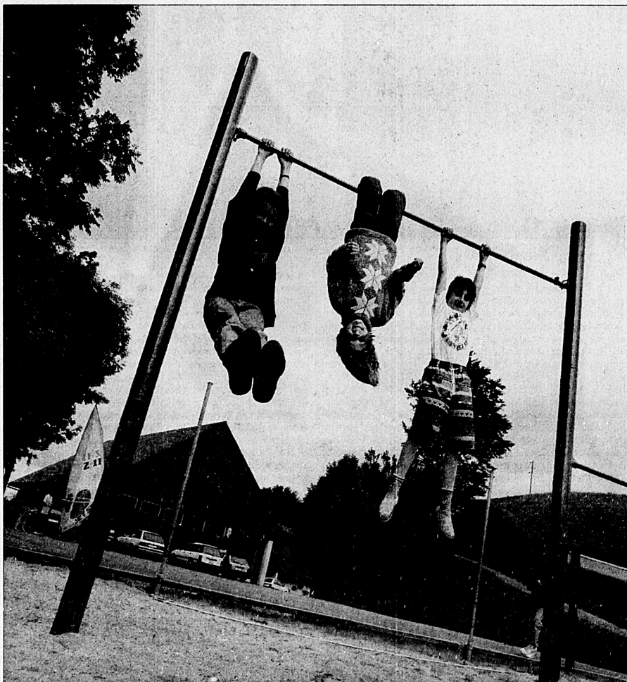
Die Sternberger Kinder werden in einer Gesamtklasse unterrichtet – durchaus zu ihrem Vorteil, wie Fachleute sagen.