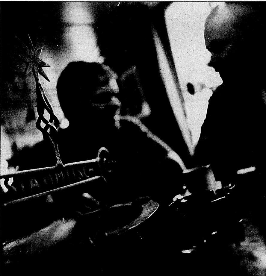
Des Nachbars Tisch ist weit entfernt, andere Restaurants sind es ebenso, der «Sternen» ist deshalb ein beliebter Treffpunkt.