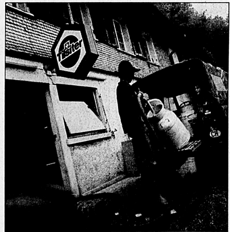
Ohne Fleiss kein Käse: gearbeitet wird hier an 365 Tagen.

Eine heile Welt sei hier oben gewiss nicht auszumachen, sagt ein älterer Einheimischer, es gehe «nur noch abwärts mit dem Sternenberg». Die Gründe dafür nennt er, mit verschränkten Armen an den Brunnen vor seinem Haus geleht, in einem anderthalbstündigen Gespräch: Zu wenig Einwohner habe Sternberg, um die